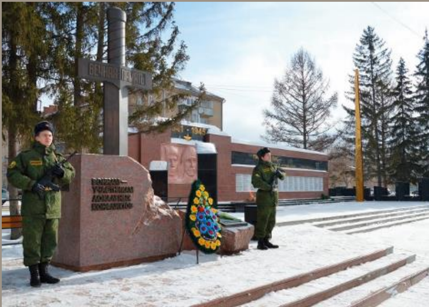
Памятник воинам-участникам локальных конфликтов в городе Южноуральске