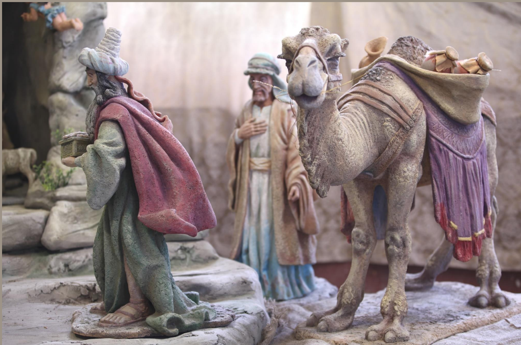
Вертеп (фрагмент) шамот