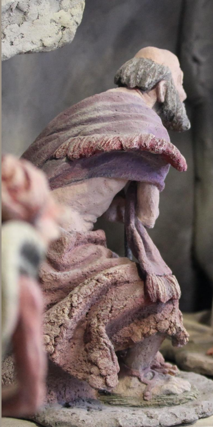
Вертеп (фрагмент) шамот