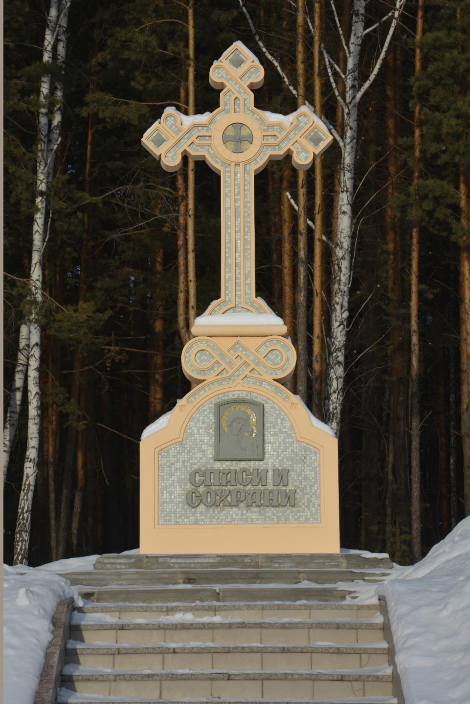
Поклонный крест Бетон, мозаика, рельеф