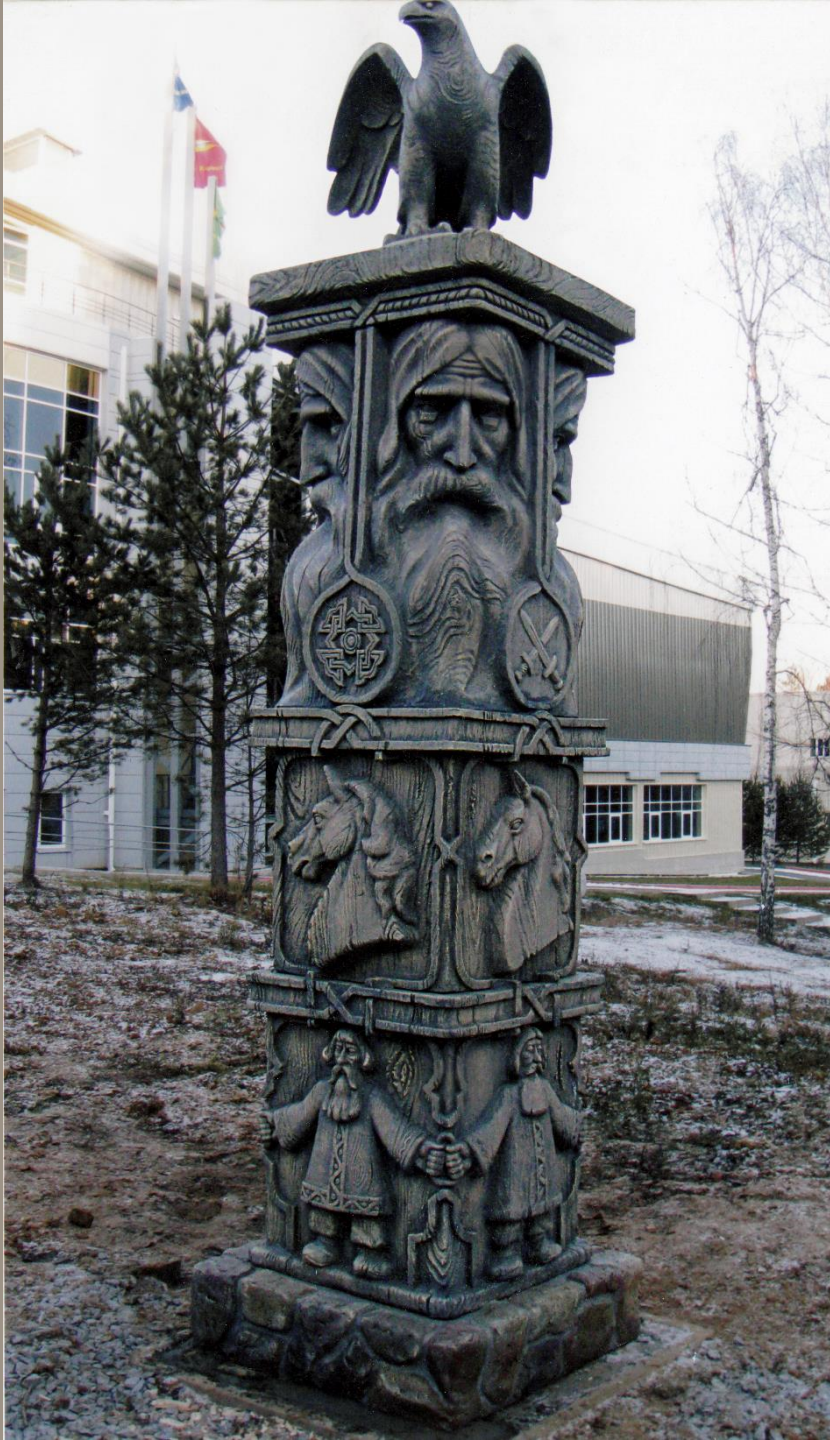
Декоративная композиция Шамот