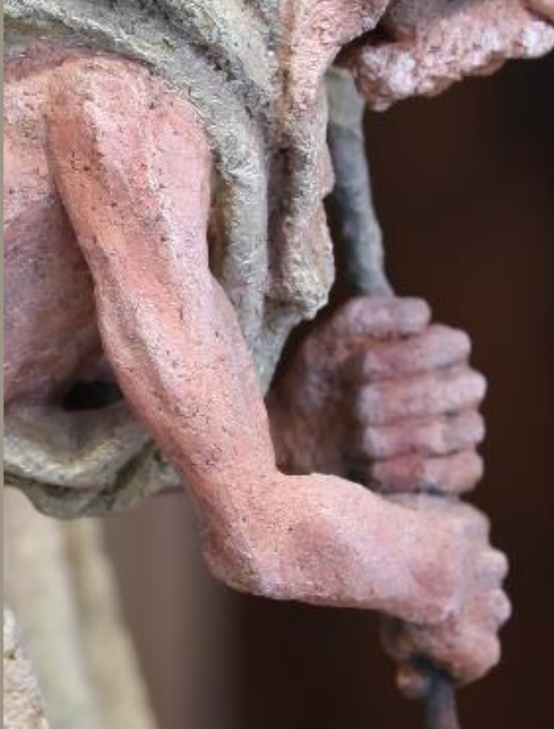
Вертеп (фрагмент) шамот