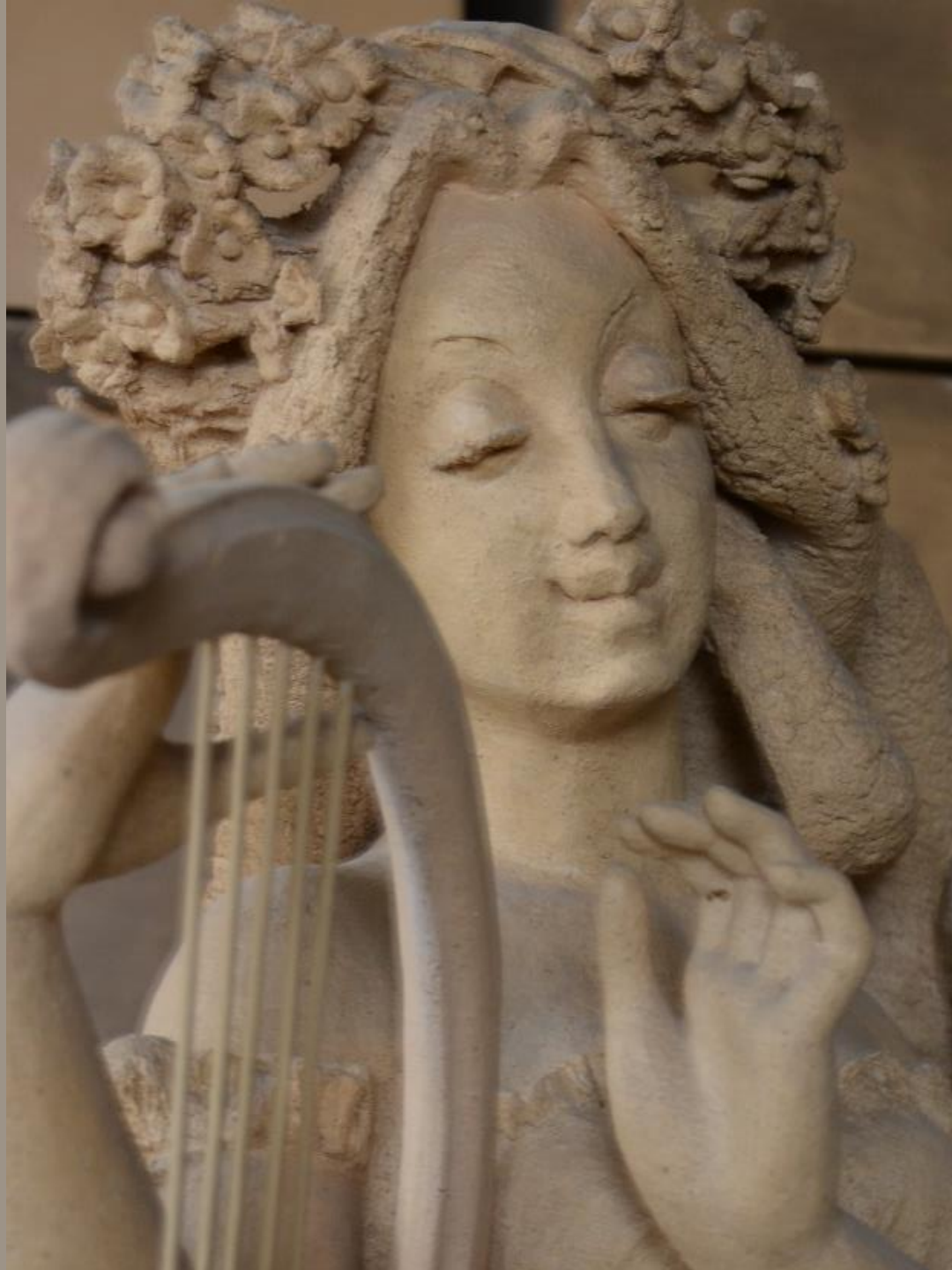
Весна (фрагмент) Шамот