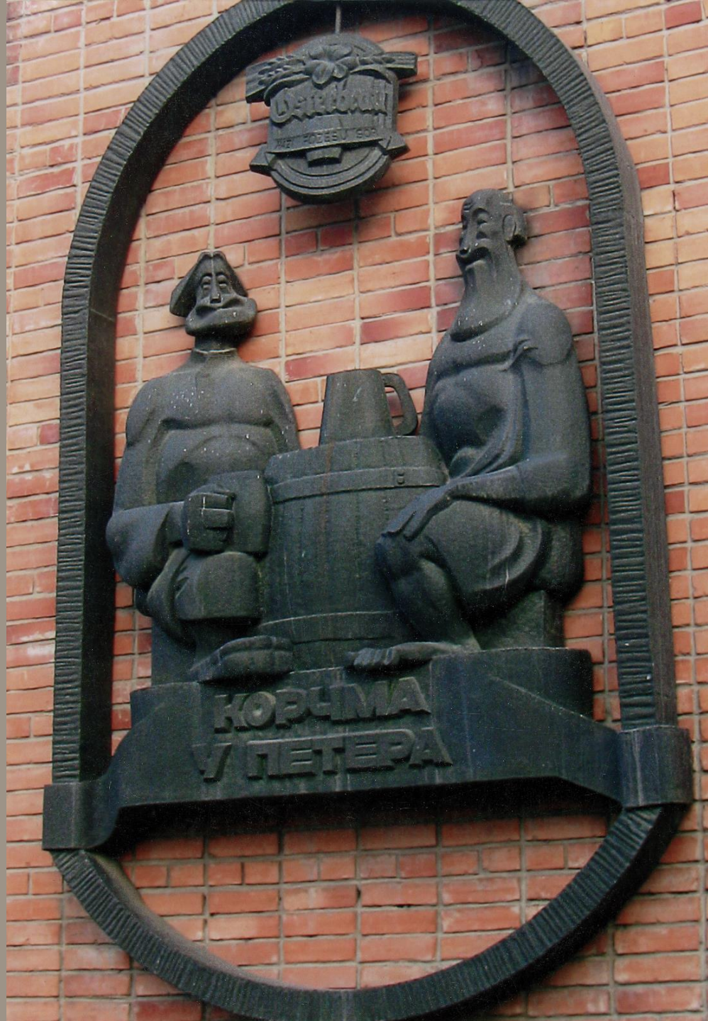
Декоративная композиция «Корчма у Петера» Медь