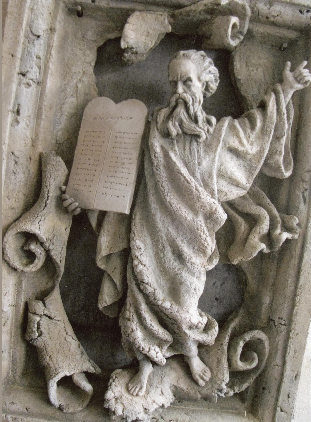
Скрижали Моисея Шамот