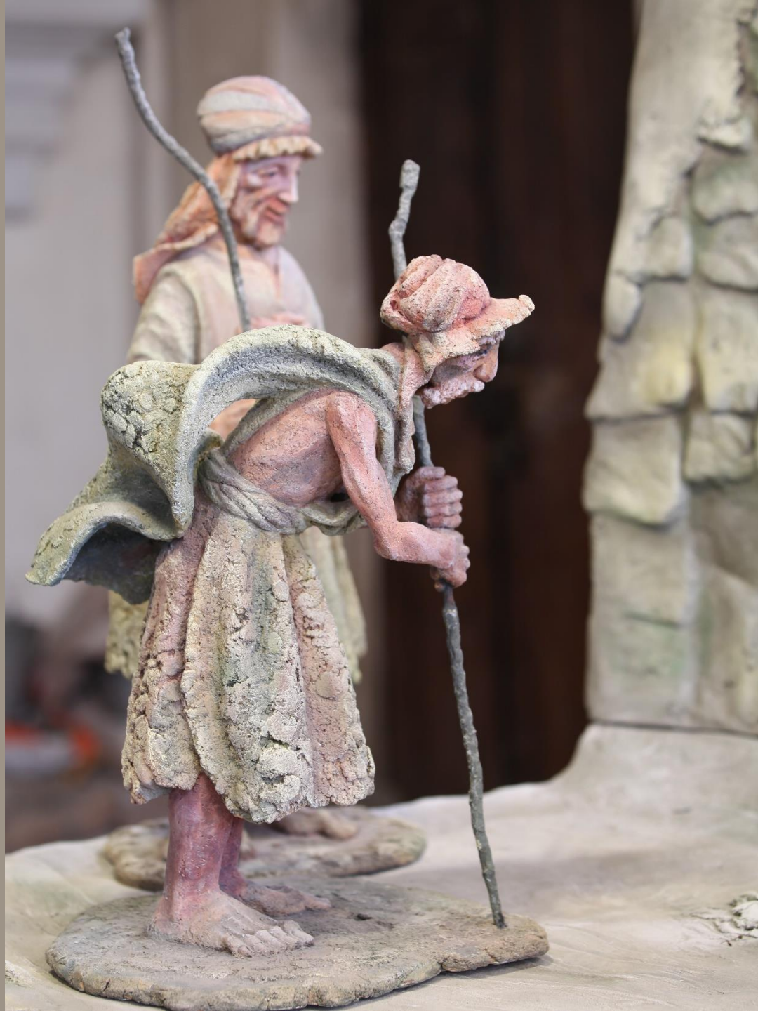
Вертеп (фрагмент) шамот