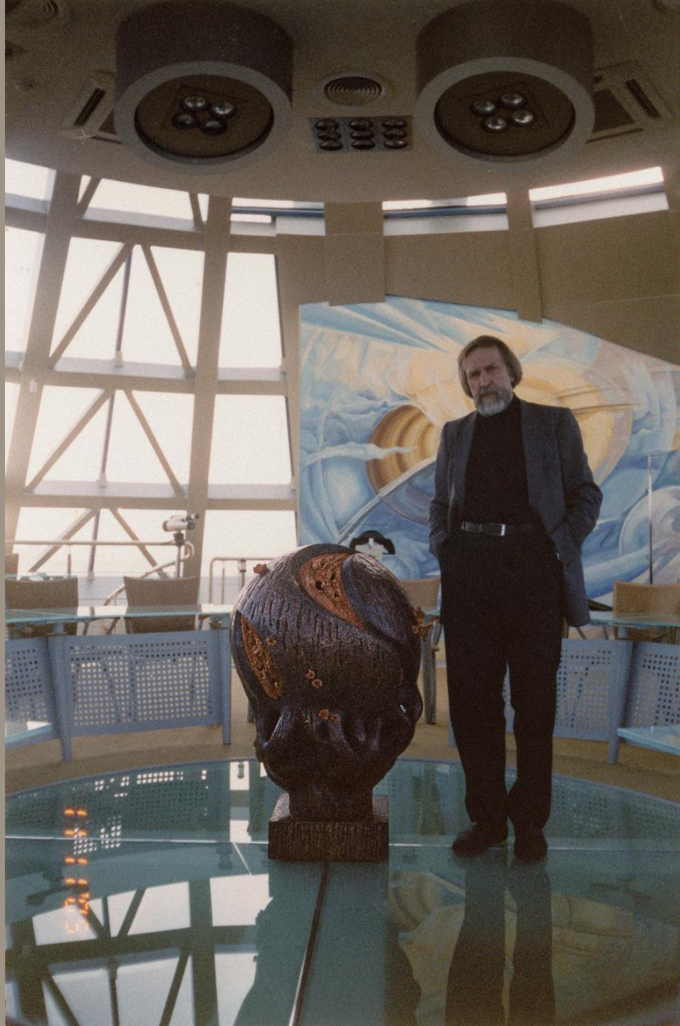
Древо мира Медь, шамот