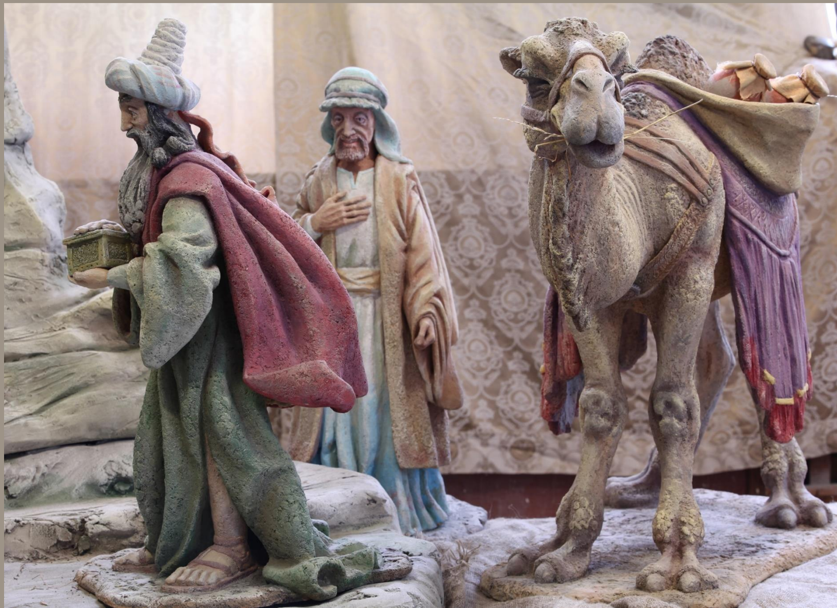
Вертеп (фрагмент) шамот