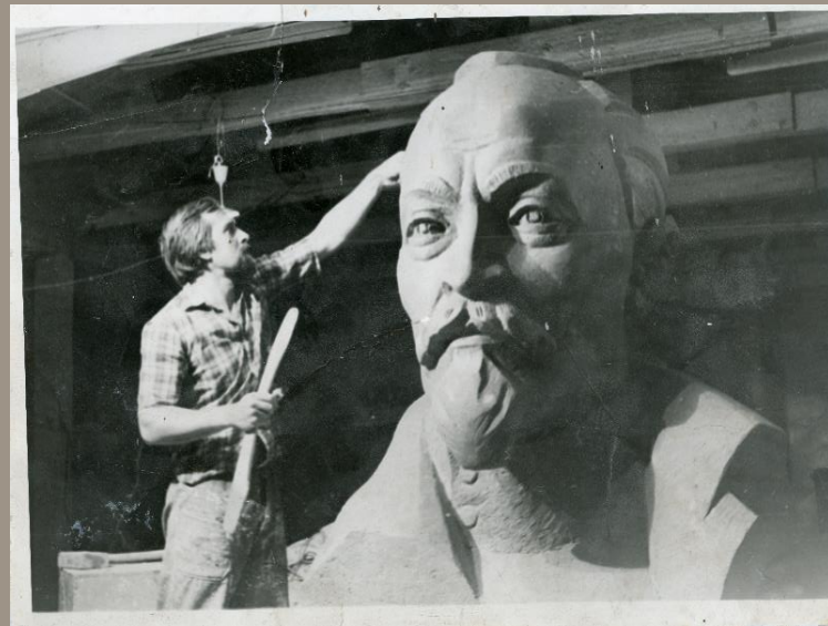
Бюст Ф.Э. Дзержинского Чугун