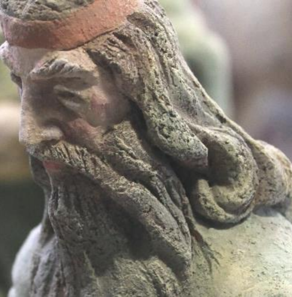
Вертеп (фрагмент) Шамот