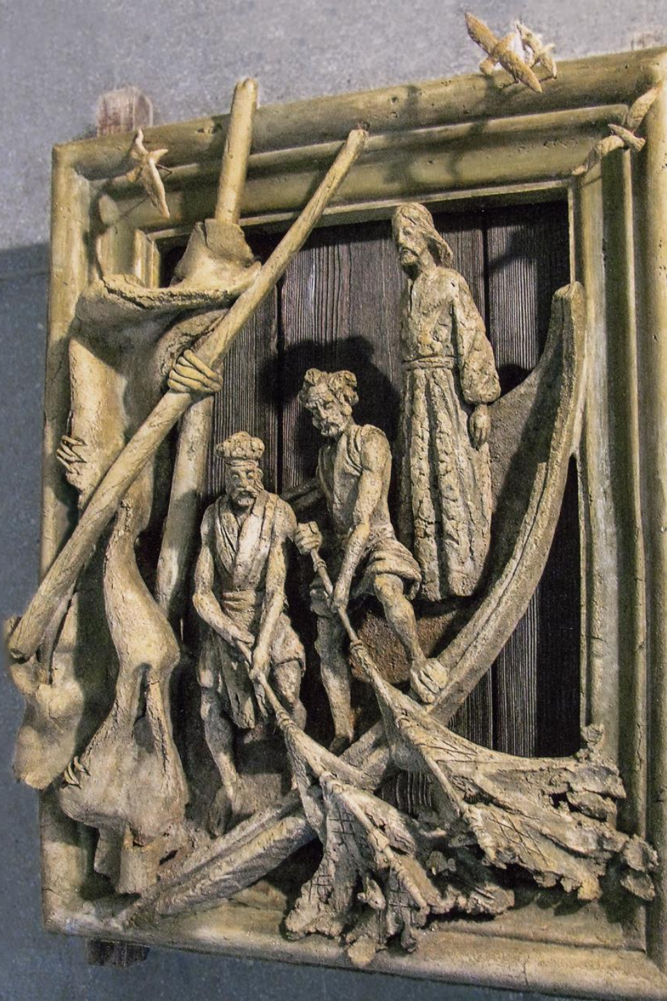
Чудесный улов рыбы Шамот