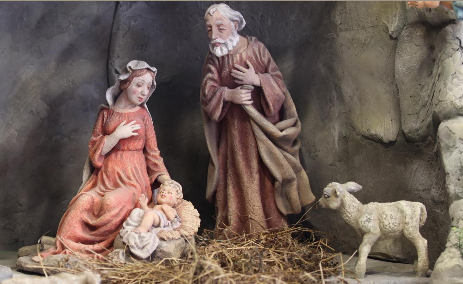
Вертеп (фрагмент) Шамот